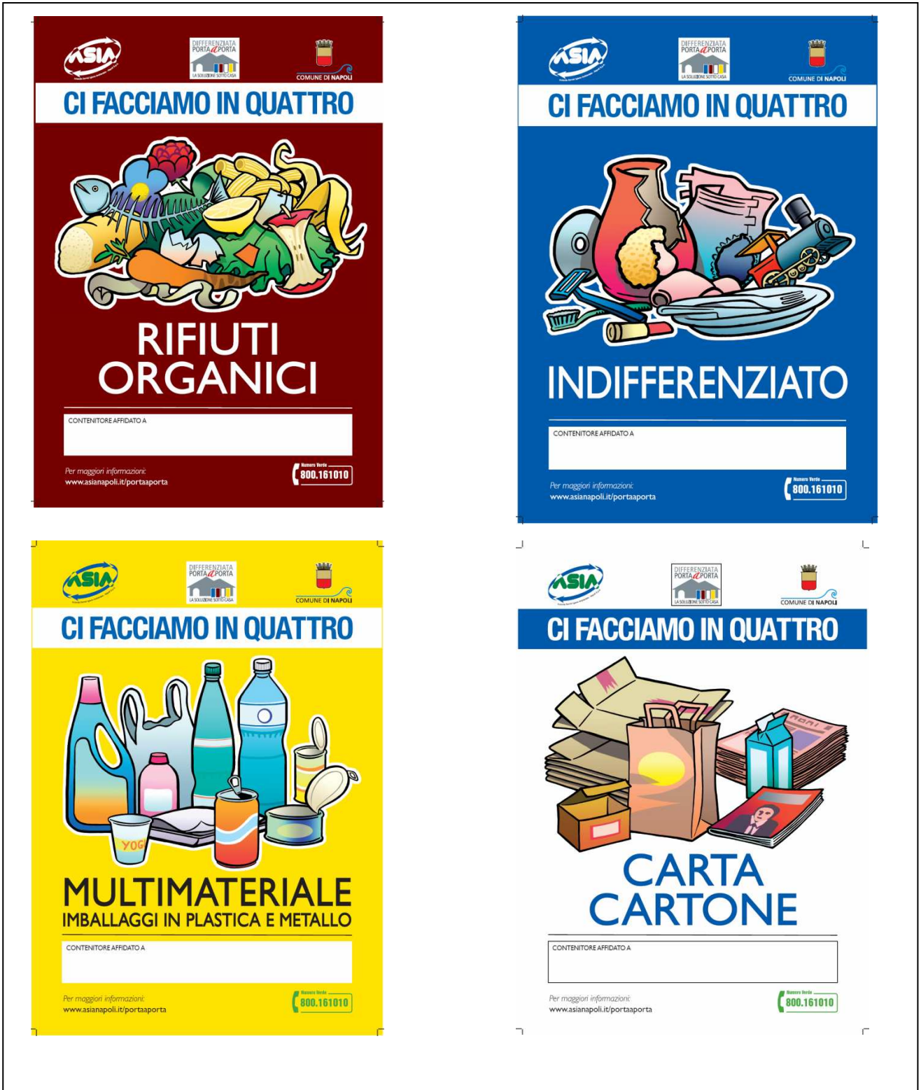
Figura 4. Progettazione grafica adesivi per i contenitori utenze domestiche

Sono inoltre stati definiti il formato, l'aspetto grafico e i contenuti degli adesivi da apporre sui singoli contenitori, che si allegano nelle figure seguenti.